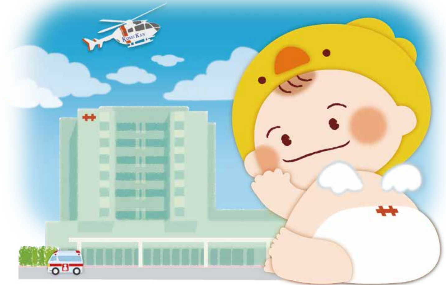
イラスト:2021年 好生館公認キャラクター『コウたん』

〒840-8571 佐賀市嘉瀬町大字中原400番地 TEL 0952-24-2171 (代表) FAX 0952-29-9390 http://www.koseikan.jp/