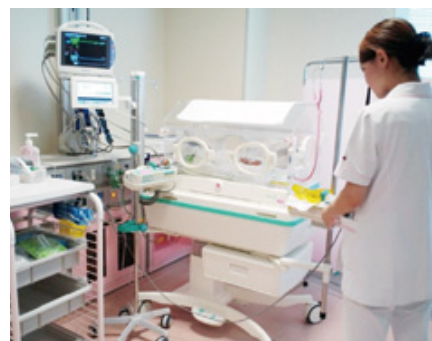
保育器と呼吸心拍モニター（通常は薄暗い照明です）