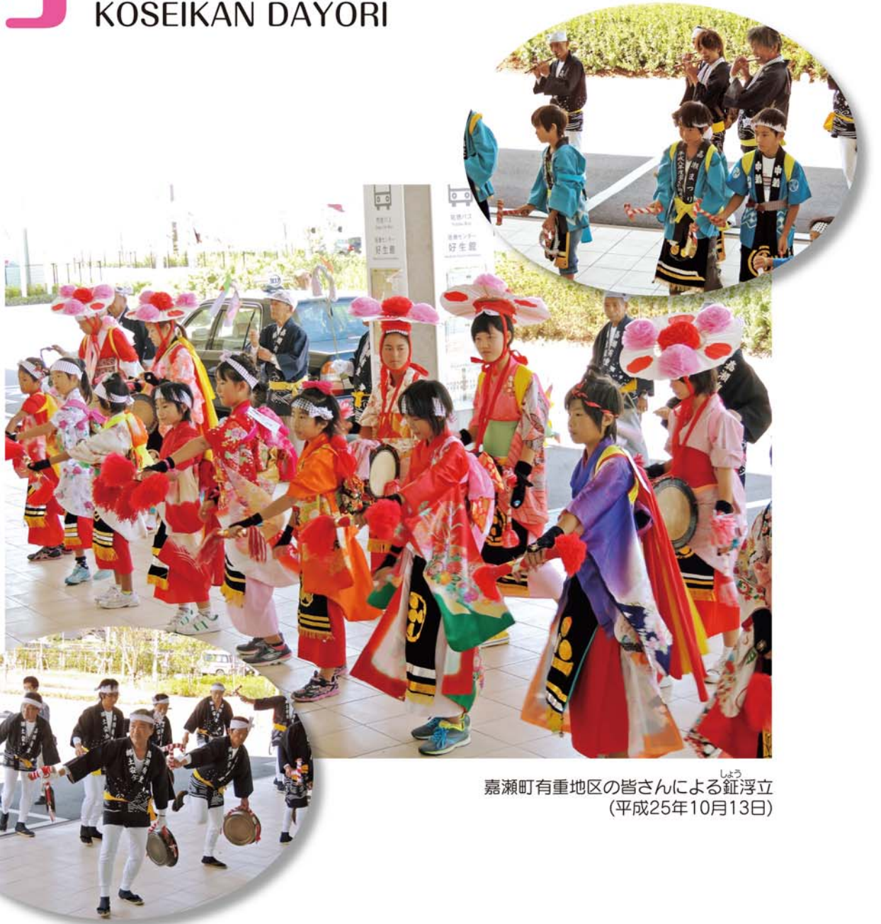
嘉瀬町有重地区の皆さんによる しょう 鉦浮立 (平成25年10月13日)