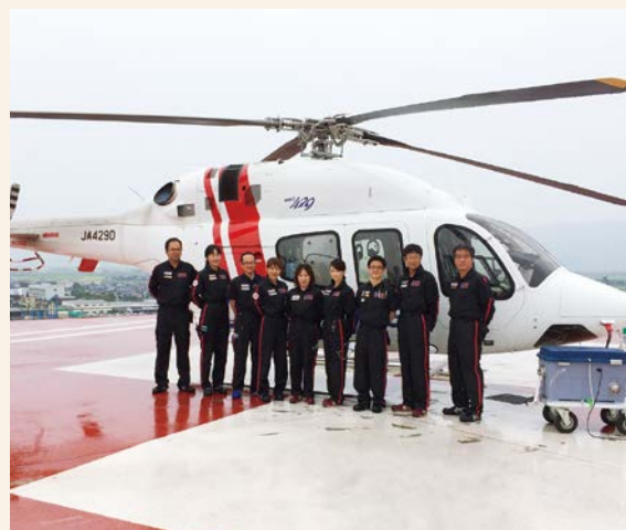
▲フライトチーム (操縦士さん、整備士さんもチームの一員です)

また現場では、医師・看護師以外にも救急消防・警察など様々な職種の方との関わりがあり、迅速な処置、情報収集、搬送準備ができるよう多職種との調整を行うこともフライトナースの重要な役割です。