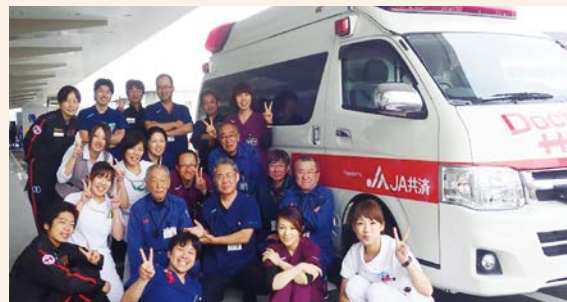
▲救命救急センターのメンバー

現場に向かう車内で、無線による情報をもとに必要な準備を行い、住居・施設、一般道、山中や川、田畑など患者がいる“その場所”で処置や治療を施します。救命が最優先ですが、状況によっては突然の場に居合わせた家族の対応をまず行うなど、常に優先順位を考えたケアを心がけています。