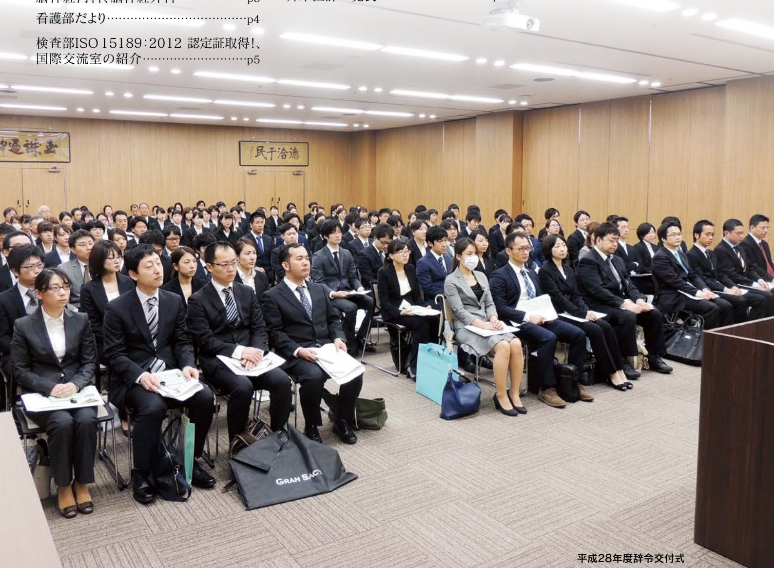
平成28年度辞令交付式