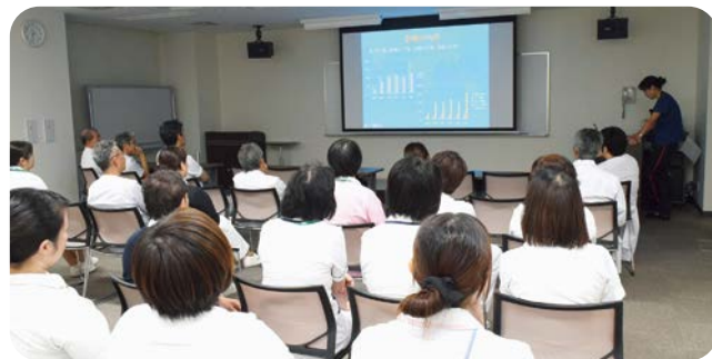
▲第1回 国際交流室セミナー

これまでに2回のセミナーを開催しました。第1回は国際医療活動の実際をJICA国際緊急援助・日赤救護・パシフィックパートナーシップにおける医療活動について、第2回は好生館で働く外国人医師から日本の児童教育との違い・中国医科大学の教育内容などについて報告しました。