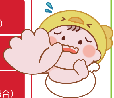
好生館マスコットキャラクター コウたん

140/90mmHgで5.9倍、160/100mmHgで10.1倍(40-64歳の場合)