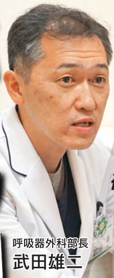
ロボット支援下手術