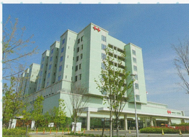
佐賀県医療センター好生館