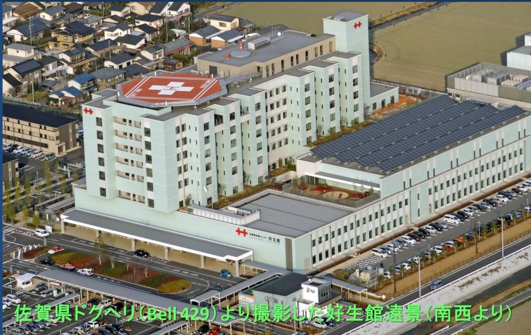
佐賀県ドグヘリ(Bell 429)より撮影した好生館遠景(南西より)