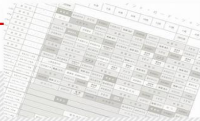
初期臨床研修プログラム