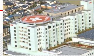
病院見学のご案内